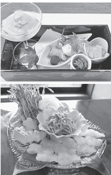
① 鰯笛吹き、鰯煮凝りなど季節の素材が満載の前菜 ② 鰯会席の強肴・鰯すき鍋