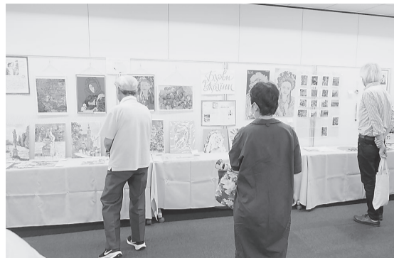
会場ではウクライナ人アーティストの作品の展示・販売を行った

ウクライナの隣国である。2022年2月にロシアがウクライナ東部に侵略して始まったウクライナ紛争により、西部ウクライナの人々は着のままで隣国ポーランドに避難した。