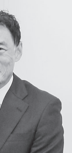
勝利至上主義ではなく誰もが等しく楽しめることこそスポーツの社会性と語る平尾先生