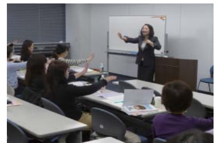
「接客研修会」で窓口対応を磨く

また、医院経営のノウハウを学べる「医院経営研究会」では「◇スタッフ採用と定着のポイント◇職員の税と社会保険◇WEBサイト・SNS対策」など年間カリキュラムをたてて、専門家を講師に開催しています。