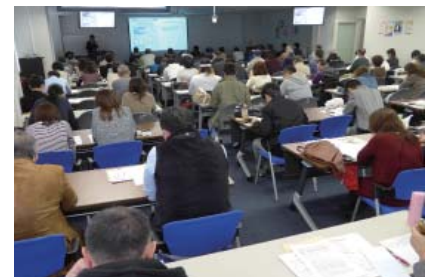
「施設基準研」で研修要件をクリア

また、診療報酬改定時には、新点数研究会を県下各地で開催。分かりやすいと好評です。