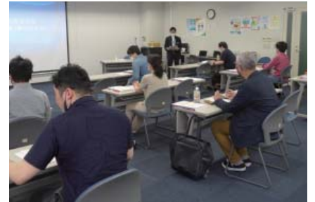
「新規開業医研」でカルテ記載等を学ぶ

また、「新規開業医研究会」を定期的に開催。午前は、新規指導の指摘事項やカルテ記載とのポイントを解説。実際に新規個別指導を受けた歯科医師による体験談も好評です。午後は税務・労務の基礎知識を学べます。