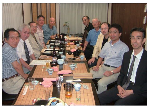
日常の診療や開業時の苦労などについて 食事を愉しみながら交流した