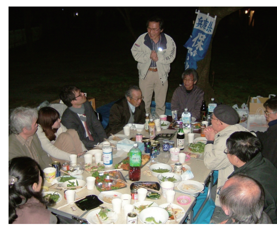
夙川公園の満開の桜を見ながら 会員同士がざっくばらんに語り合った