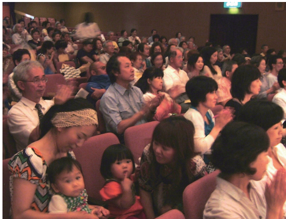
ロイド氏のお話と演奏に惜しみない拍手を送る参加者