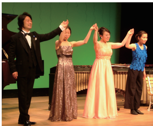
コンサートの最後に舞台上で観客に挨拶する4人の出演者

10月27日、西宮市民会館で、SFCC実行委員会と共催のチャリティ企画を開催。医師・市民ら217人が参加した。