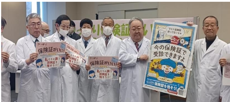
白衣を着て保険証存続を訴える先生方