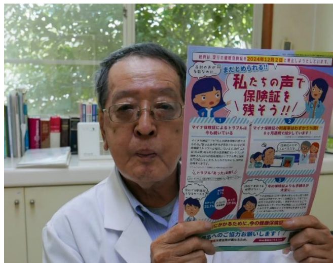
署名活動に積極的に取り組む

医療の現場・患者が求めているデジタル化に反対です。現行の保険証を残して患者が医療を受けやすい環境を整えることこそが重要だと思います。マイナ保険証の押しつけは利権がからんでいて、大企業の利益のための「隠れた公共事業」になっています。（次ページにつづく）