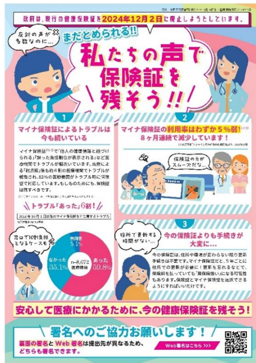
「現行の健康保険証を残してください」署名