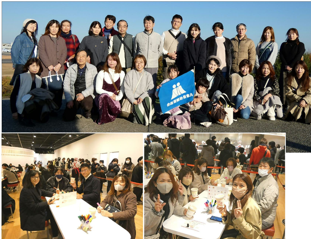
伊丹スカイパークで集合写真(写真上)オリジナルカップヌードル作りを楽しんだ(写真下)

支部では1月26日、4年ぶりに秋のバスツアー「マイカップづくり体験と酒蔵&伊丹空港離発着見学」を開催。会員や家族ら23人が参加した(1月5日付兵庫保険医新聞に参加者感想文を掲載)。