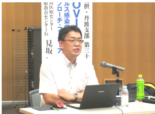
コロナ感染の後遺症の症状とアプローチを詳しく説明する見坂先生