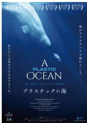
2016年/イギリス・香港/短縮版22分/日本語吹替

私たちが日ごろ利用しているペットボトルやレジ袋など、いたるところに使われているプラスチック。そのプラスチックによる海洋汚染や生態系への影響がいま深刻な問題になっています。その影響は人間にも及び、私たちの健康を脅かしています。