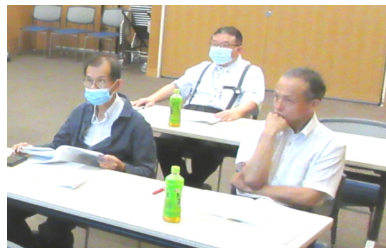
熱心に聞き入る参加者。会場とZoomをあわせて57人が参加した

(1面からのつづき) 目等)の説明がありました。 先生の自験例に中枢性の脳・神経の障害によると思われる副腎不全の多いことに驚かされました。 呼吸器障害でさえそう簡単に治るとも思われないう、ましてや90日も経てば当然そう簡単に治るはずがないと思われま